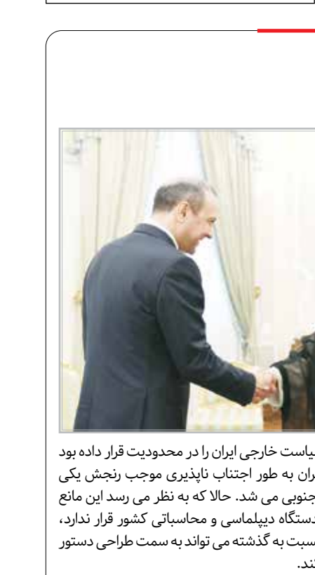
ارمنستان بود، انتخاب‌های سیاست خارجی ایران را در محدودیت قرار داده بود

دستگاه دیپلماسی ایران همچنین مطرح کرد: تردیدی وجود ندارد که جمهوری اسلامی ایران به این اقدام غیرقانونی، تحریک آمیز و نقض آشکار تکلیفات اتحادیه اروپا، فرانسه، آلمان و انگلیس وفق برجام و قطعنامه ۲۲۳۱ شورای امنیت سازمان ملل به صورت مقتضی و در چارچوب حقوق خود ذیل برجام پاسخ خواهد داد.