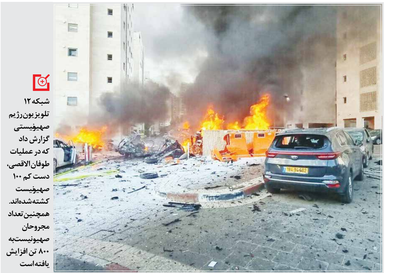
رسانه‌های رژیم صهیونیستی گزارش دادند که در عملیات طوفان الاقصی، هزار نیروی مبارز فلسطینی به شهرک‌های یهودی نشین اطراف غزه حمله برند و همچنین دست کم ۱۰۰ شهیونیست از زمان آغاز این عملیات به هلاکت رسیده‌اند.

وی همچنین به موضوع جنگ ۳۳ روزه در سال ۲۰۰۶ نیز اشاره کرد و گفت: در جریان این جنگ مقاومت در لبنان بار دیگر اثبات کرد که هیمنه رژیم صهیونیستی در برابر مقاومت مسلحانه مقتدرند در ۵۰ سال اخیر چنین عملیاتی رخ نداده است. فتلگراف‌ها در یک عملیات غافلگیرانه نزدیک به ده‌ساعتی اسرائیلی را به هلاکت رساندند و ده‌ها نفر هم مجروح و اسیر شدند؛ البته این اطلاعاتی است که برعزم پایگوت رسانه‌ای منتشر شده است.