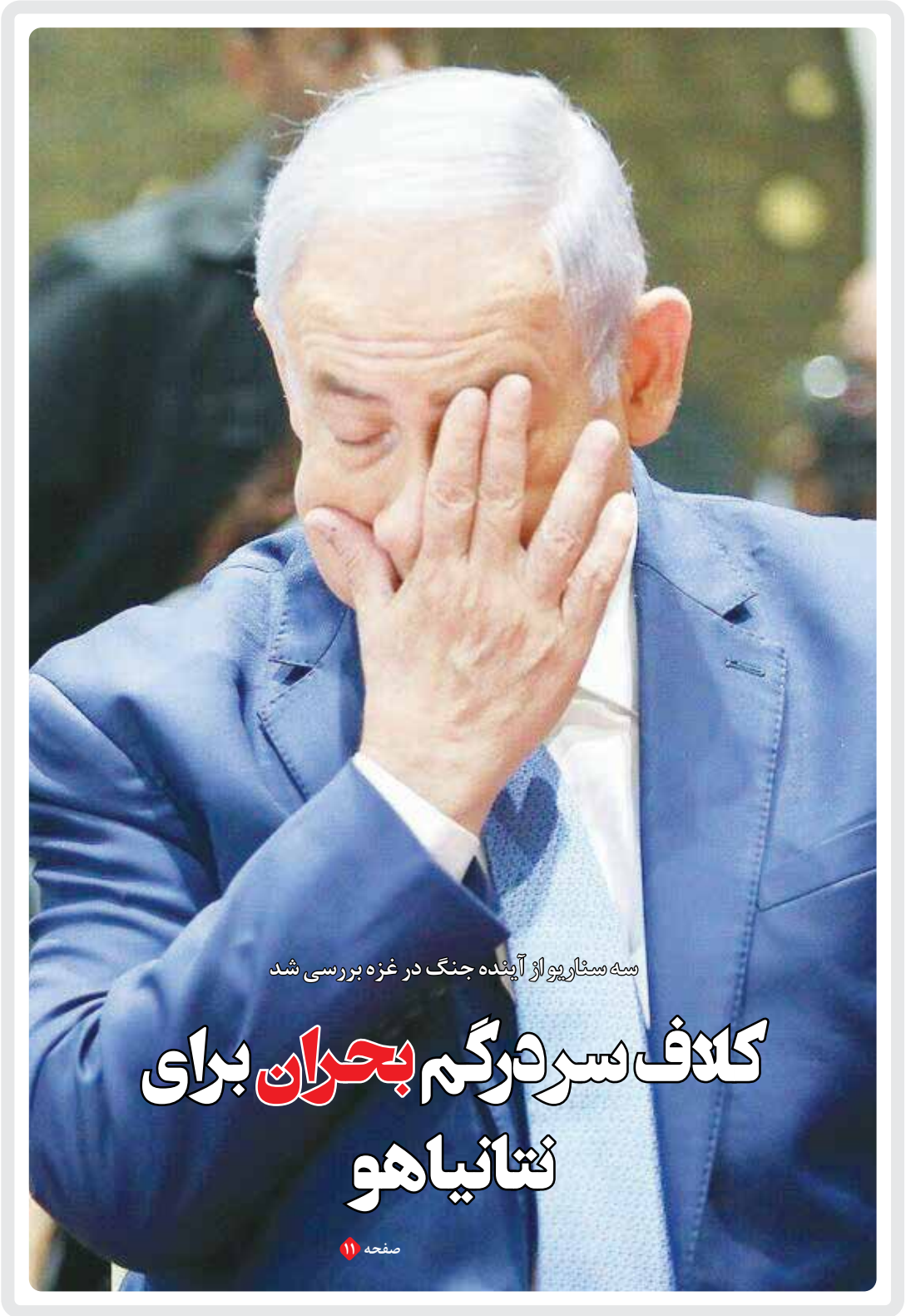
صحنه سیف‌الروح از آینده جنگ در غزه بررسی شد