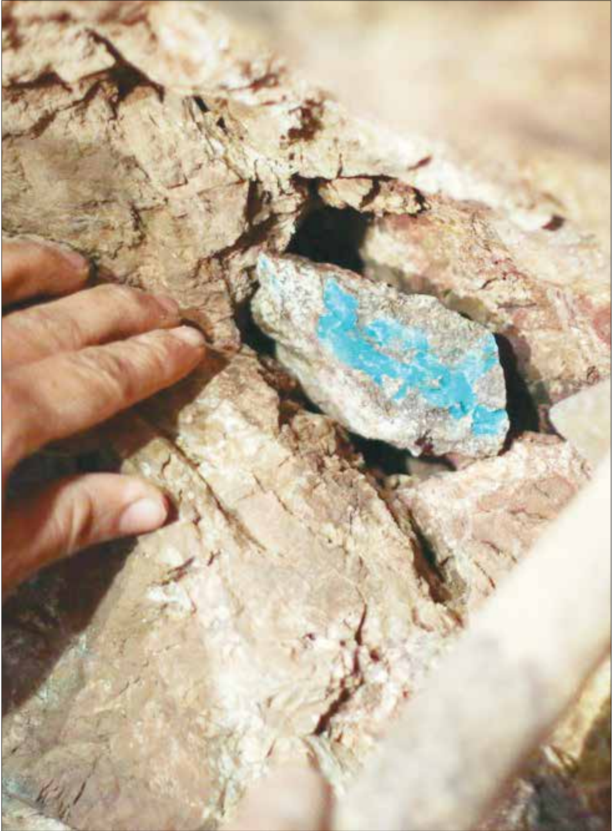
معدن فیروزه- نیشابور