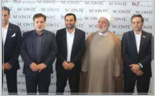
مدیر کل صمت استان البرز اعلام کرد:

بیش از ۱۷۰۰ واحد پرورش گاو شیری بالاتر از ۵۰ راس وجود دارد که در آنها ۵۵۰ هزار راس دام سنگین