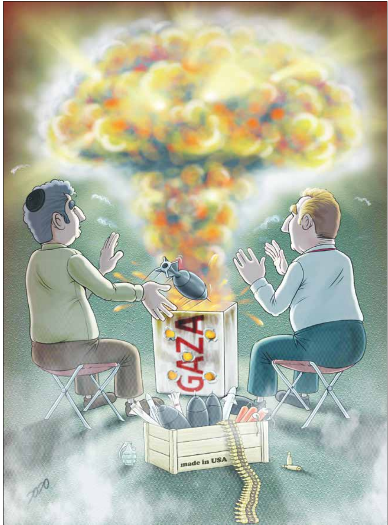
طرح: محمد طحانی