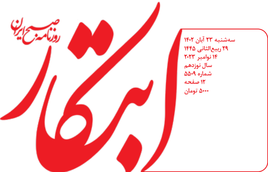
سه‌شنبه ۲۳ آبان ۱۴۰۲