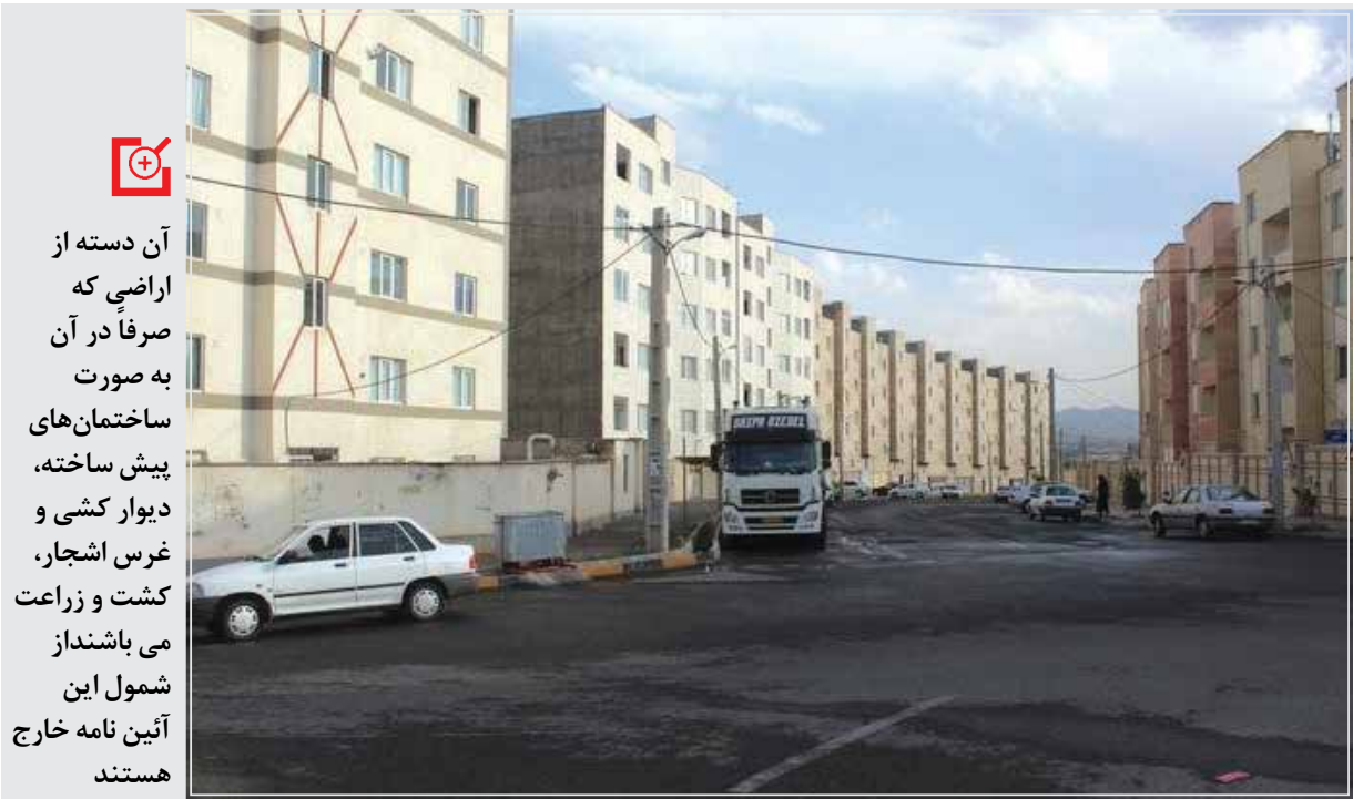
محمدی بابیان اینکه براساس دستور العمل ابلاغی، متقاضیان تحت پوشش دستگاه‌های حمایتی (کمیته امداد و بهزیستی)،و همچنین متقاضیان مشمول سه دهک پایین درآمدی در درخواست متقاضی، امکان تقسیم میالغ ارزش عرصه در بازه حداکثر ۵ ساله بدون لحاظ سود ناشی از تقسیم‌بلامانع است.

رییس اداره واگذاری اداره کل راه و شهرسازی استان زنجان گفت: عرصه ساختمان‌های احداثی مسکونی در اراضی تصرفی دولتی در زنجان به قیمت تمام شده واگذار می‌شود.