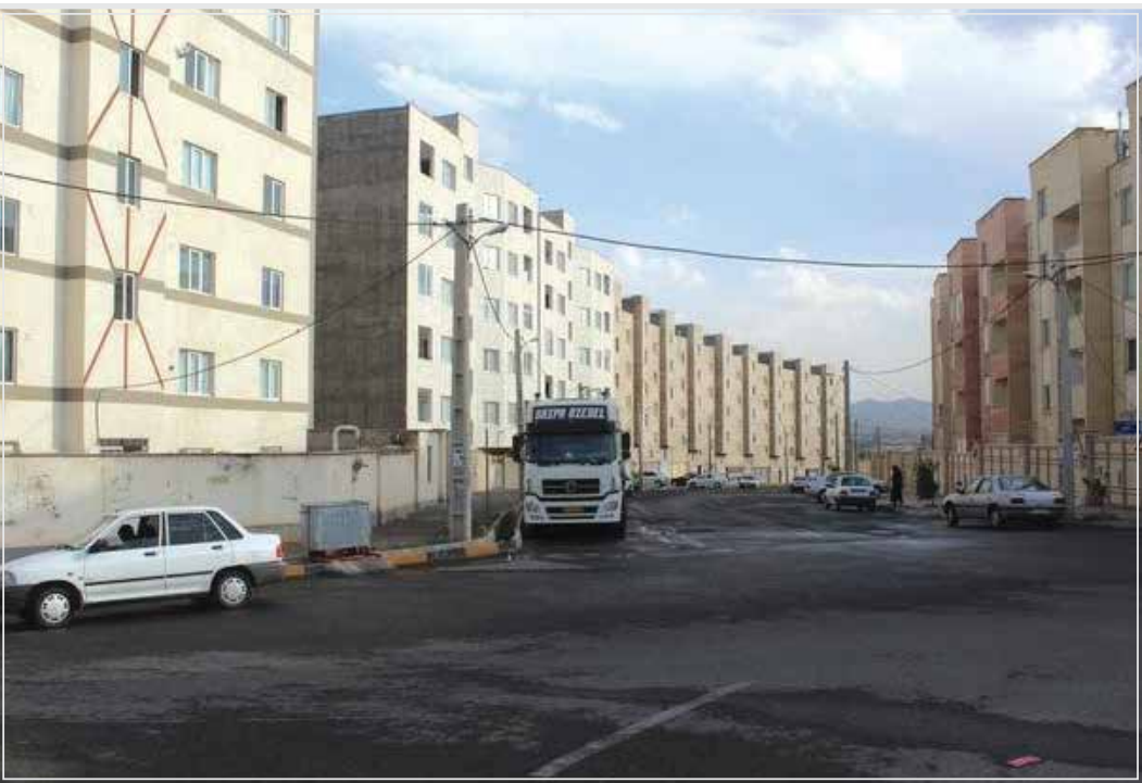
محمدی بابیان اینکه براساس دستور العمل ابلاغی، متقاضیان تحت پوشش دستگاه‌های حمایتی (کمیته امداد و بهزیستی)،و همچنین متقاضیان مشمول سه دهک پایین درآمدی در درخواست متقاضی، امکان تقسیم میالغ ارزش عرصه در بازه حداکثر ۵ ساله بدون لحاظ سود ناشی از تقسیم‌بلامانع است.

رییس اداره واگذاری اداره کل راه و شهرسازی استان زنجان گفت: عرصه ساختمان‌های احداثی مسکونی در اراضی تصرفی دولتی در زنجان به قیمت تمام شده واگذار می‌شود.