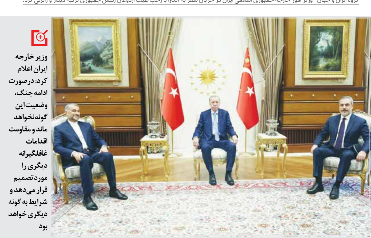
رئیس‌جمهوری ترکیه نیز دیدار و رایزنی می‌کند. وی همچنین با تقدیر از مواضع مقامات ترکیه به ویژه رئیس‌جمهوری این کشور در مورد تحولات اخیر در اراضی اشغالی و محکومیت جنایت های جنگی رژیم صهیونیستی در غزه گفت: جمهوری اسلامی ایران به رایزنی‌های خود با کشورهای منطقه و دیگر کشورها برای جلوگیری از گسترش دامنه جنگ ادامه می‌دهد.

وزیر خارجه ایران در ادامه تأکید کرد: حماس یک جنبش آزادی‌بخش است و فعالیت آن در راستای مقابله با اشغالگران است.