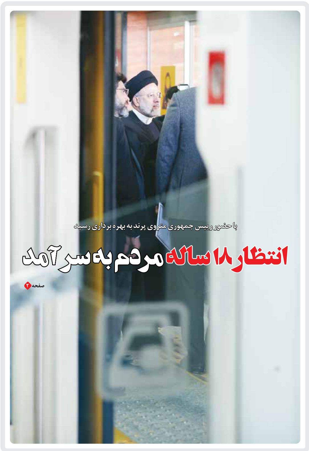
پاخشور رییس جمهوری مترووی پرنده بهره برداری رسید