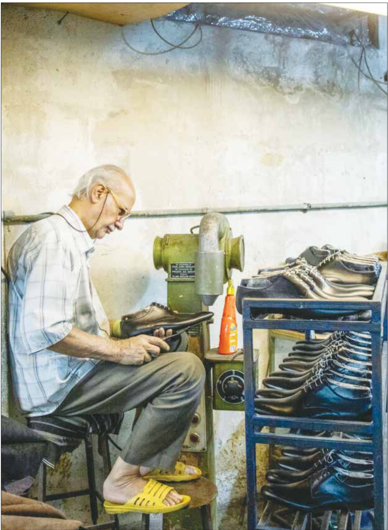
کفاشان بازار تهران