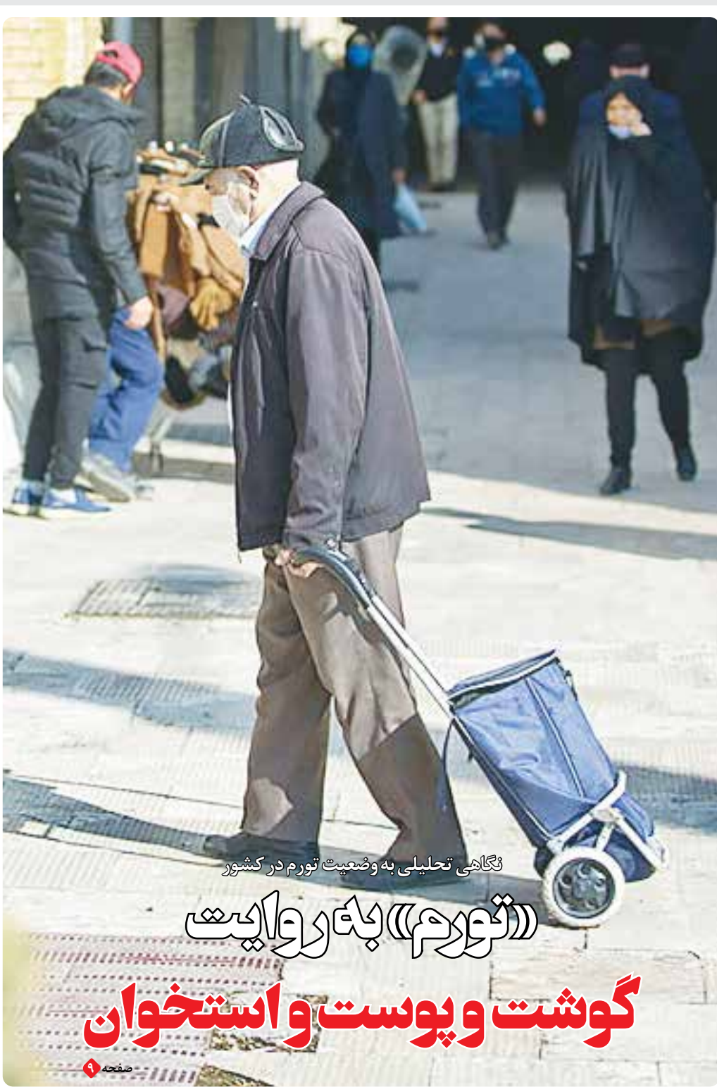
نگاهی تحلیلی به وضعیت تورم در کشور