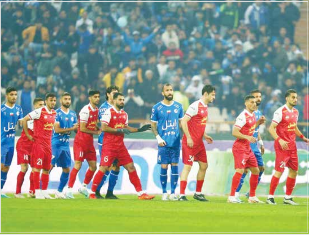
قانون سقف بودجه به یک بحران بزرگ در فوتبال ایران تبدیل شده است.

تبریز به دلیل پذیرش مالیات ۶ مرپی و بازیکن خارجی به ۶ میلیارد جریمه، بدون کسر امتیاز محکوم شده است.