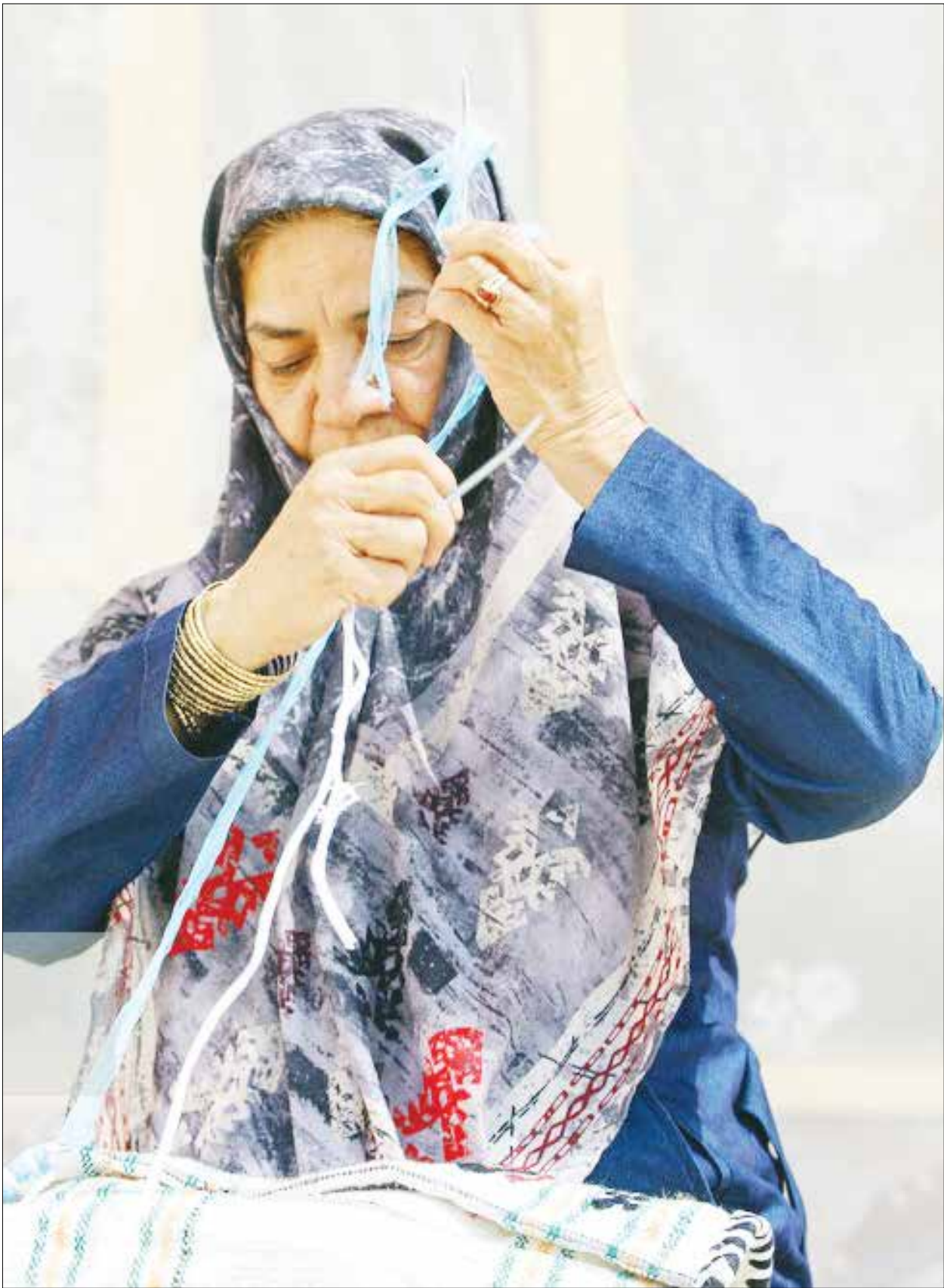
خورچین بافی هنر دستان اهالی کوبیر