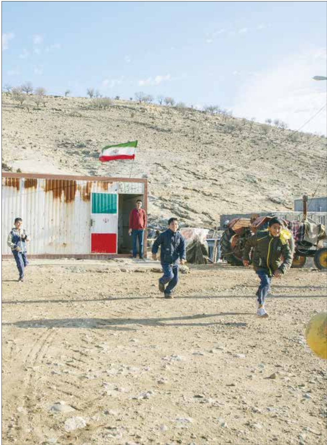
عکس: ترانه بازداري / ایسا دبستانی در دل رشته کوه‌های زاگرس