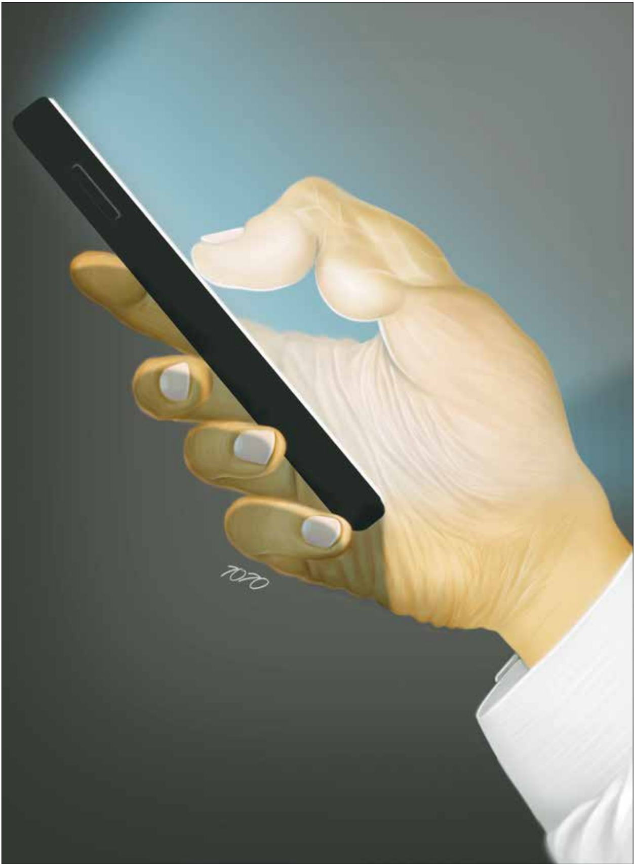
طرح: محمد طحانی