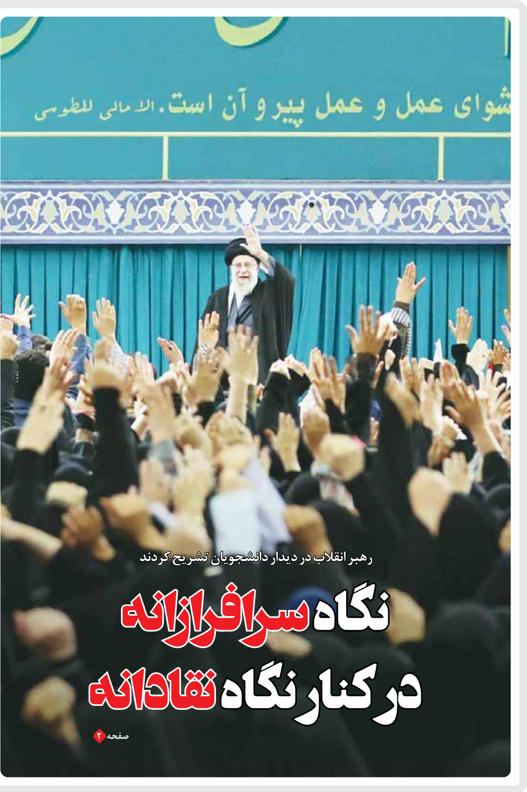
رهبر انقلاب در دیدار دانشجویان تشریح کردند