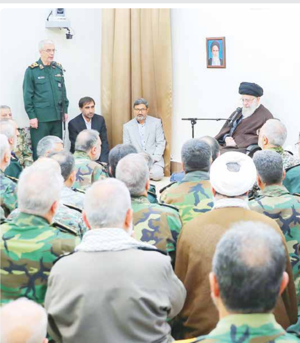
رهبر معظم انقلاب: