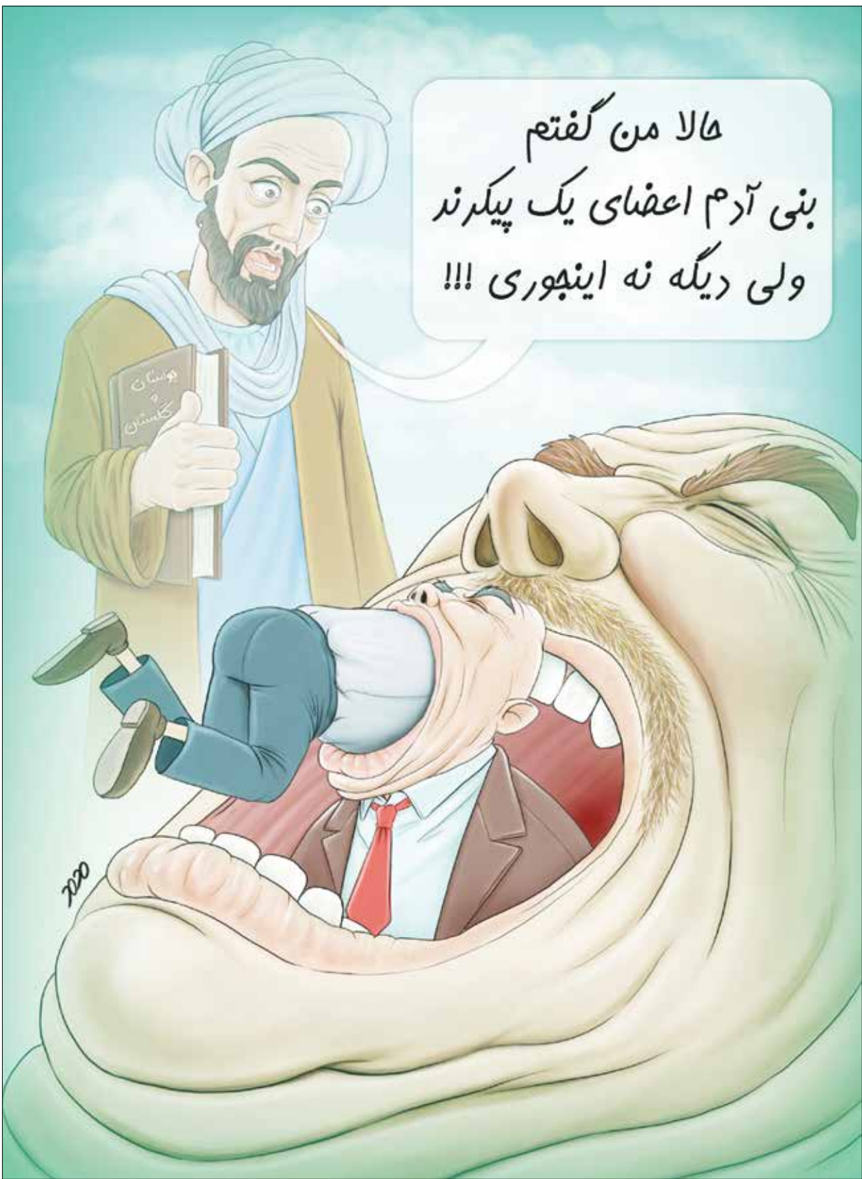
طرح: محمد طحانی