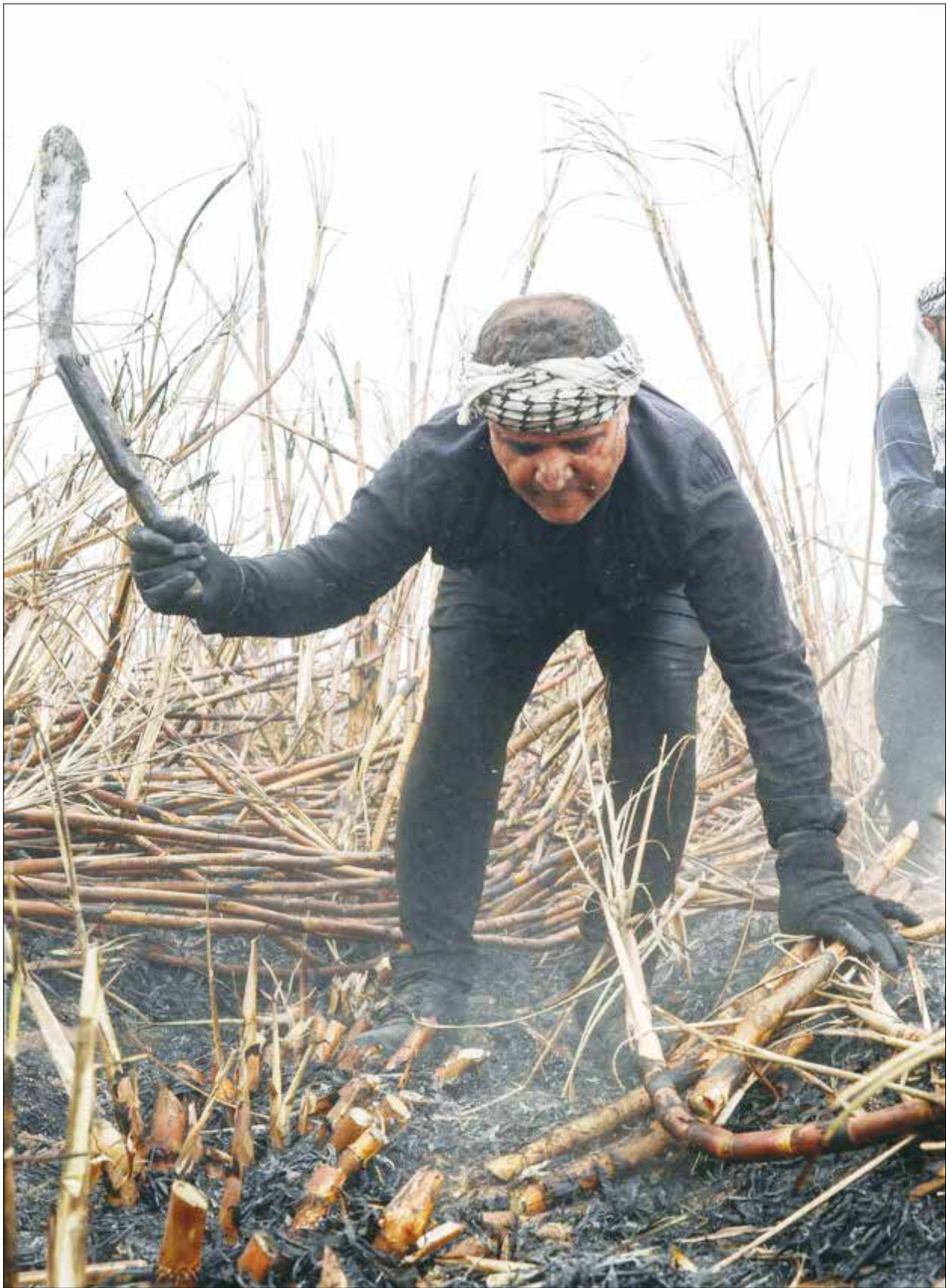
کارگران هفت تپه