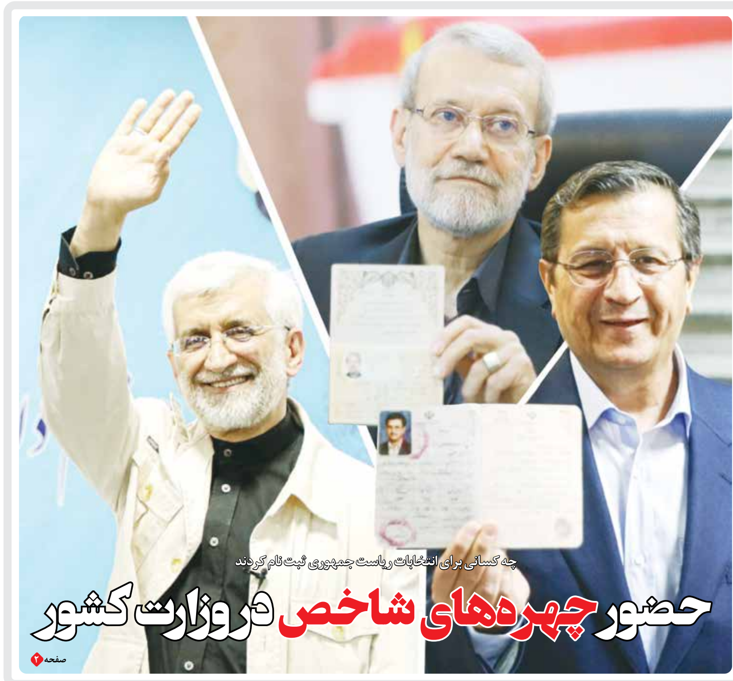
چه کسانی برای انتخابات ریاست جمهوری ثبت نام کردند