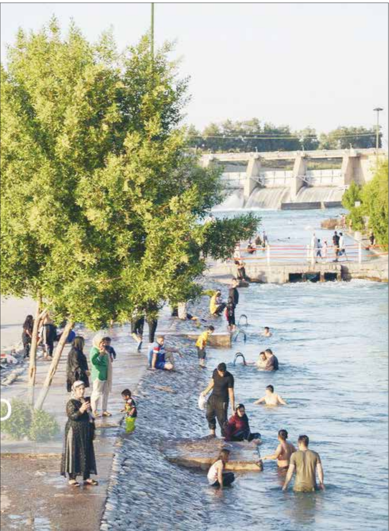
شنا در علی کله دزفول – استان خوزستان