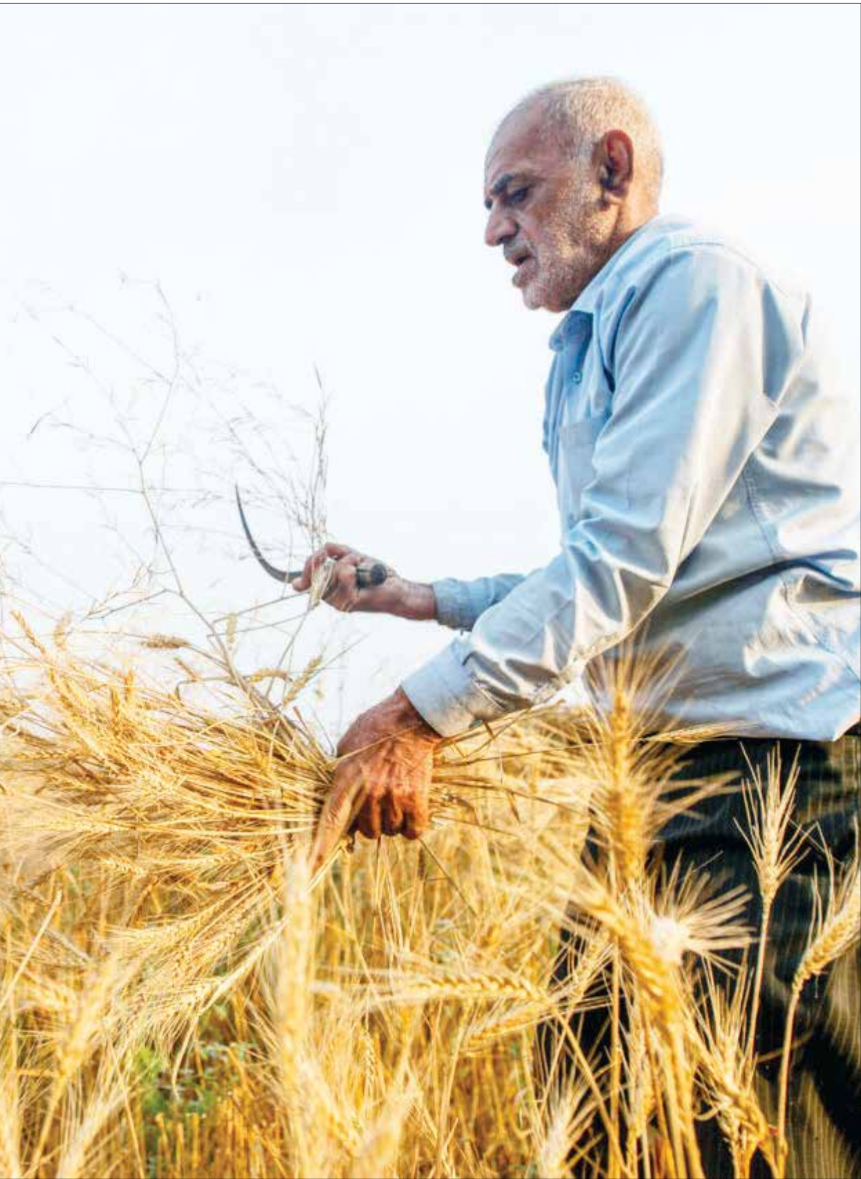
فصل برداشت گندم