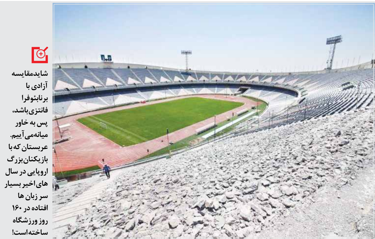
ورزشگاه آزادی به دلیل عملیات بازسازی توانایی میزبانی در لیگ و بازی‌های ملی را برای فصل پیش رو ندارد.

آویزان شده‌است. این در حالی است که ما درست در پایتخت ایران تنها یک ورزشگاه از ۵۰ سال پیش تا کنون داریم که حالا به وضعیت بحرانی رسیده است.