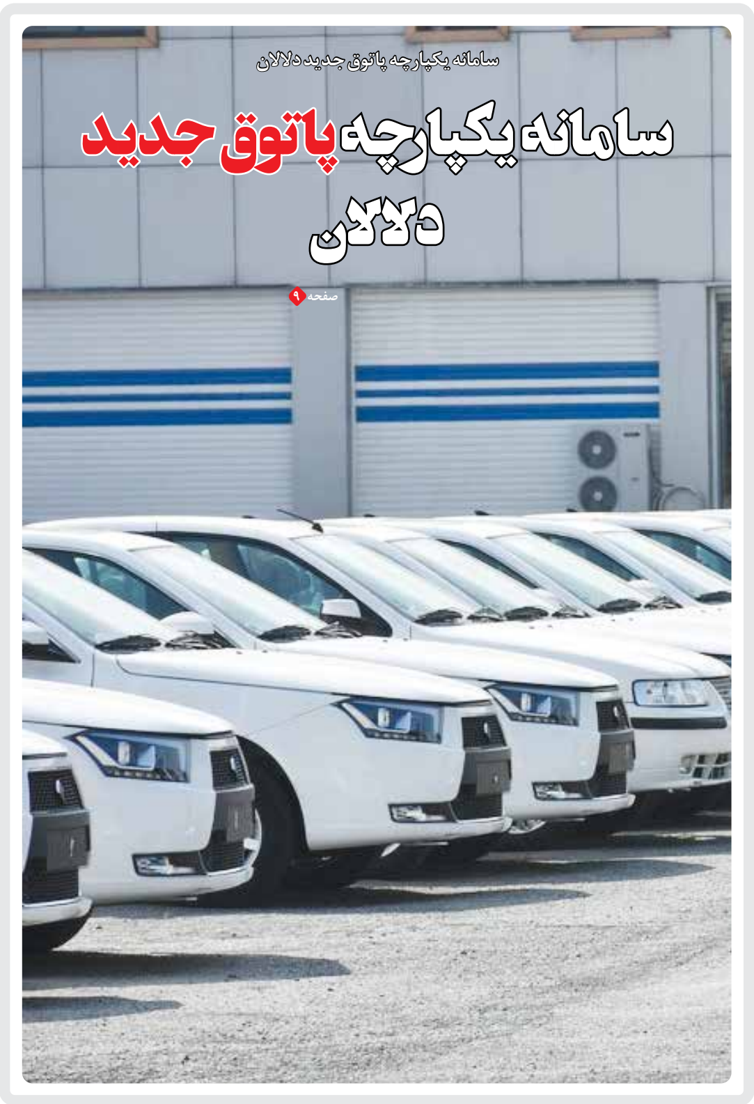
سامانه یکپارچه پاتوق جدید دلاکان