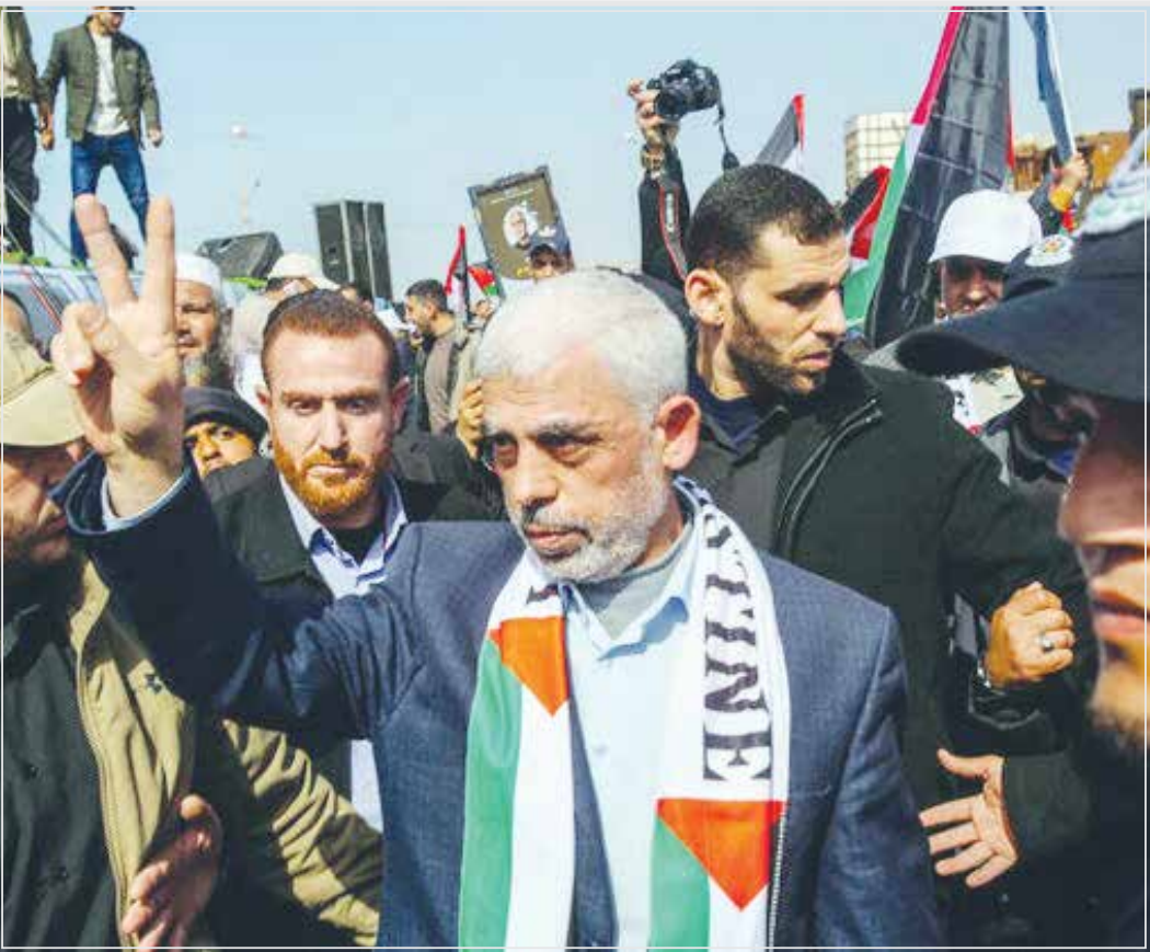
کارشناس مسائل منطقه و فلسطین گفت که انتخاب «السنوار» به عنوان رئیس دفتر سیاسی جنبش حماس، نشان داد که جریان مقاومت به مبارزه ادامه خواهد داد و انتخاب فردی که سمبل مقاومت، جهاد و میدان است شرایط را برای اسرائیل سخت‌تر کرده است.

گالانت و تشدید تنش‌های داخلی در سرزمین های اشغالی گفت: اختلافاتی در حاکمیت سیاسی رژیم صهیونیستی از سال ۲۰۱۱ رخ داده است، اعتراضات سیاسی و امنیت را فراهم کنید در حالی که نزدیک به ۴۰۰ هزار نفر از شهرک‌نشینان به مکانی دیگر منتقل و آورده‌شده‌اند، گفت: در ۱۰ ماه گذشته نتائیاوه نتوانسته کاری کند که این افراد به خانه‌هایشان بازگردند و مجموعه کارهای اقتصادی در این اراضی نیز تعطیل شده است. از این رو می‌توان ادعا کرد که طوفان الاقصی فضای اعتراضات داخلی را تشدید کرده است و هر قدمی که رژیم برمی‌دارد از جمله ترور اسماعیل هنیه، حمله به کنسولگری ایران در دمشق، حمله به لبنان و سوریه، برای ماجراجویی است که می تواند به قیمت موجودیت رژیم صهیونیستی تمام شود. معترضان معتقدند هر چه دامنه جنگ گسترده‌تر و زمان آن طولانی شود نه تنها امنیت ایجاد نمی‌شود بلکه بیشتر آن را به خطر می‌اندازد؛ حرفی که گالانت و دیگر مقامات مخالف نتائیاوه مطرح می‌کنند.