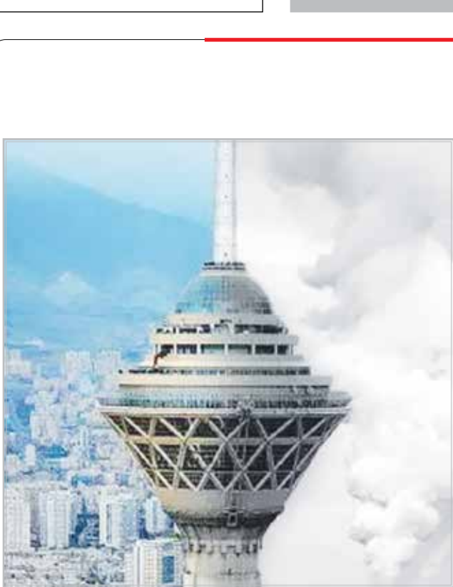
میرزایی قمی اعلام کرد

در ایران نیز افزایش شدید دمای هوا در کنار نزدیک شدن دمای شب و روز فشار بی‌سابقه‌ای را به شبکه‌های تأمین آب و برق وارد کرد و به واسطه فعال شدن شبانه‌هیزی سامانه‌های سرمایشی، مصرف برق خانگی را نسبت به سال‌های گذشته به مراتب افزایش داد و به دنبال رکورد شکنی‌های مکرر تقاضای مصرف برق، میزان مصرف برق کشور نسبت به سال گذشته ۹ درصد بیشتر شد. شرایطی که با اتخاذ تدابیر لازم و اجرای برنامه‌های مدیریت مصرف با کمترین مشکل در تأمین برق پایدار کشور سپری شد و امید می‌رود با کاهش دما در روزهای آتی پایداری شبکه برق نیز هر چه بیشتر تداوم یابد.