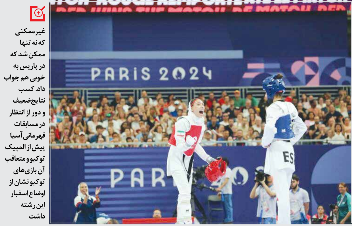
مبارزه تکواندو در المپیک ۲۰۲۰ پاریس

تکواندو ایران درحالی با کسب چهار مدال طلا، نقره و برنز عنوان موفق‌ترین فدراسیون در المپیک سی‌وسوم را به خود اختصاص داد که پیش از حضور در پاریس کمتر کارشناسی پیش‌بینی چنین نتایجی را می‌کرد.