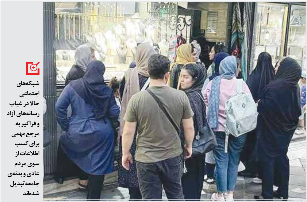
بازار طلاروز ۱۳ صفر وضعیت خاصی را تجربه کرد و شلوغی این بازار سبب شد تصاویر عجیبی از خریداران طلا در شبکه‌های اجتماعی به اشتراک گذاشته شود.

می‌شود حرف بی‌مبنایی این را جا انداخت، این امکان هست که حرف‌های مفید را جا بیندازیم.