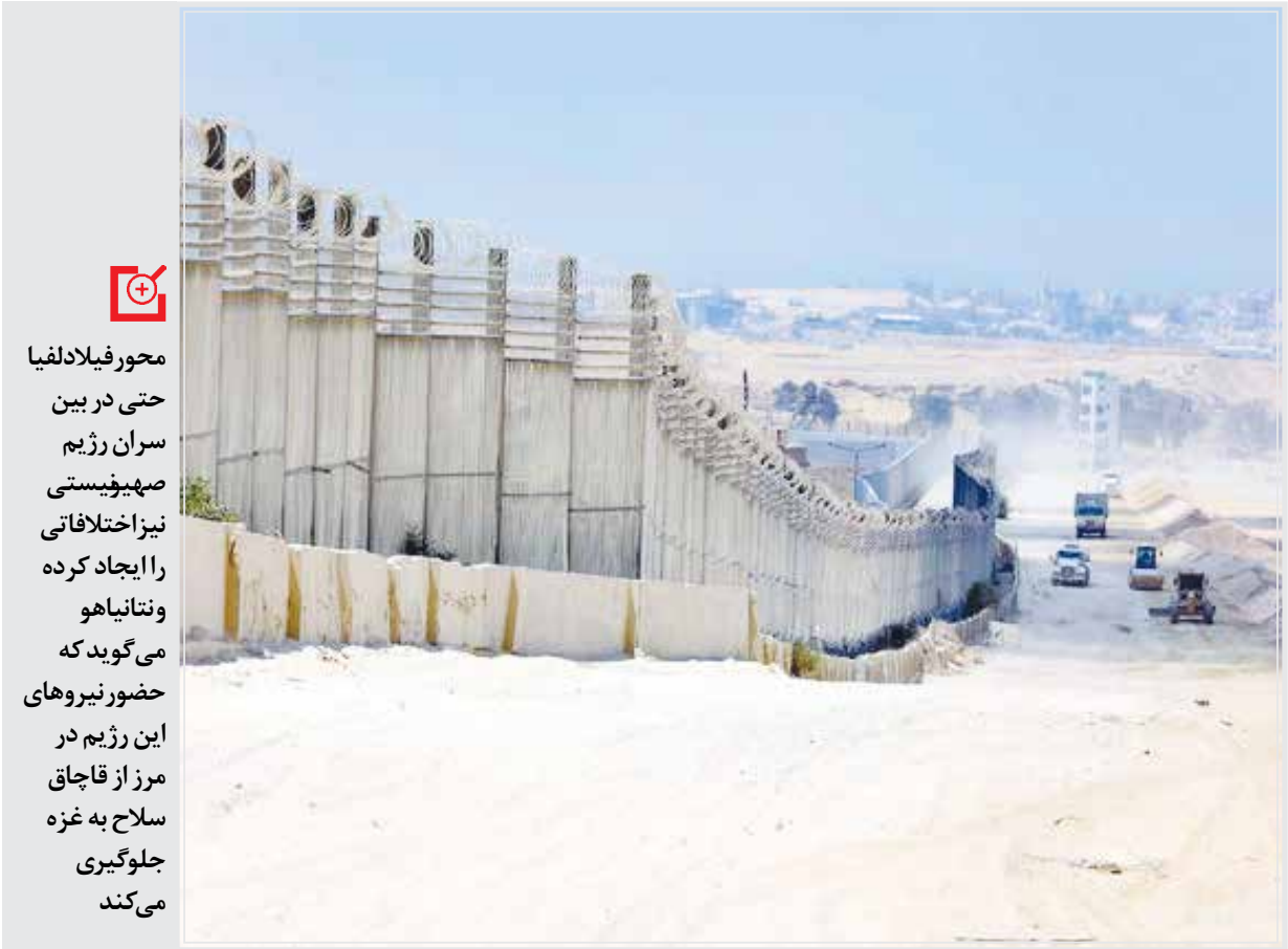
محور فیلالدلیا به یکی از مهم‌ترین نکات اختلافی در مذاکرات آتش‌بس غزه تبدیل شده است؛ اما ماجرای این اختلاف چیست؟

جنش حماس و دیگر گروه‌های مقاومت فلسطین این اقدام تل‌آویو را تلاش دیگری از سوی این رژیم برای تحمیل «محاصره» و «خفه کردن» غزه می‌دانند. «محمدالمقable» کارشناس اردنی درباره اصرار نتانیاھو بر تسلط بر محور فیلالدلیا و ماندن در آن می‌گوید: او می‌خواهد با صحبت در مورد لزوم کنترل اسرائیل بر محور فیلالدلیا میان مصر و نوار غزه، به اهداف سیاسی و نظامی دست یابد.