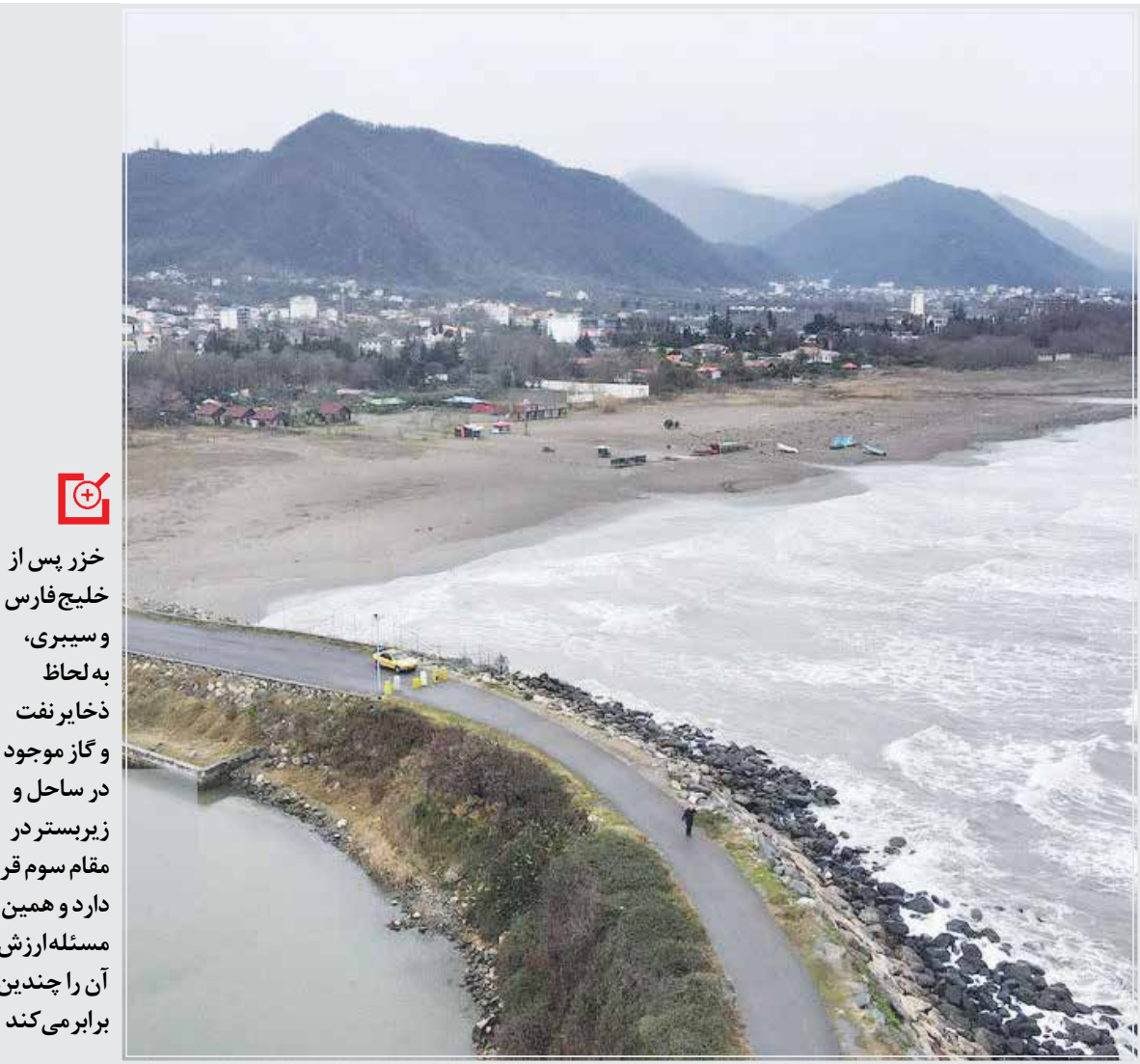
دریاچه خزر در استان مازندران، ایران. دریاچه خزر دریاچه‌ای است که در شمال غربی ایران واقع شده است.

پس‌رفت سطح آب دریای خزر اتفاقی است که نه تنها برای ایران بلکه برای سایر کشورهای حاشیه این پهنه آبی از اهمیت زیادی برخوردار است و در حال چاره‌اندیشی برای آن هستند. در این شرایط ایران چه نقشی می‌تواند داشته باشد؟