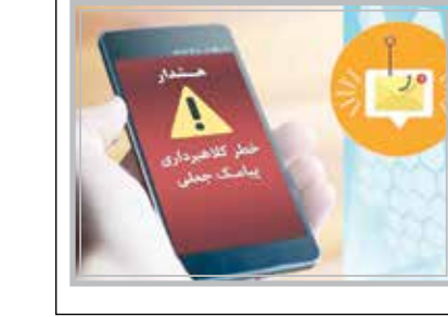
پیامک جعلی حاوی لینک آلوده که می‌تواند منجر به سرقت اطلاعات کاربر شود.

رئیس پلیس فتا تهران بزرگ با تأکید بر اینکه مهمترین عامل پیشگیری از این نوع کلاهبرداری، افزایش آگاهی در این خصوص است به شهروندان توصیه کرد: به پیامک‌های ناشناس که دارای لینک هستند توجه نکنند و دقت داشته باشند که هیچ سازمان رسمی و حاکمیتی از جمله قوه قضائیه و … با شماره‌های شخصی برای ارسال پیامک ارسال نمی‌کنند، شهروندان همچنین می‌توانند هرگونه موضوع مشکوک و مشابه را از طریق تماس با شماره ۱۱۰، مرکز فوریت‌های سایبری ۰۹۶۳۸۰ و یا سایت پلیس فتا به آدرس www.Fata.gov.ir گزارش کنند.