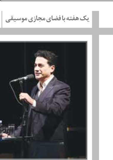
یک هفته با فضای مجازی موسیقی