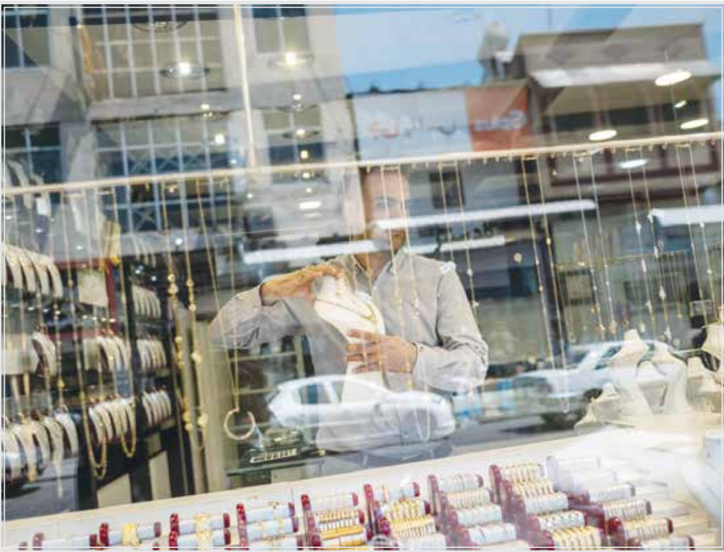
بازار طلا در تهران

گروه اقتصاد - در پایان روز کاری یکشنبه نرخ هر سکه تمام بهار آزادی به بالاترین نرخ تاریخ خود در کشور دست یافت و از کانال ۵۵ میلیون تومانی هم گذر کرد. این میان یک کارشناس اقتصادی معتقد است که افزایش نرخ طلا به هر دلیلی که باشد، تبعات تورمی سهمگینی برای اقتصاد کشور خواهد داشت.