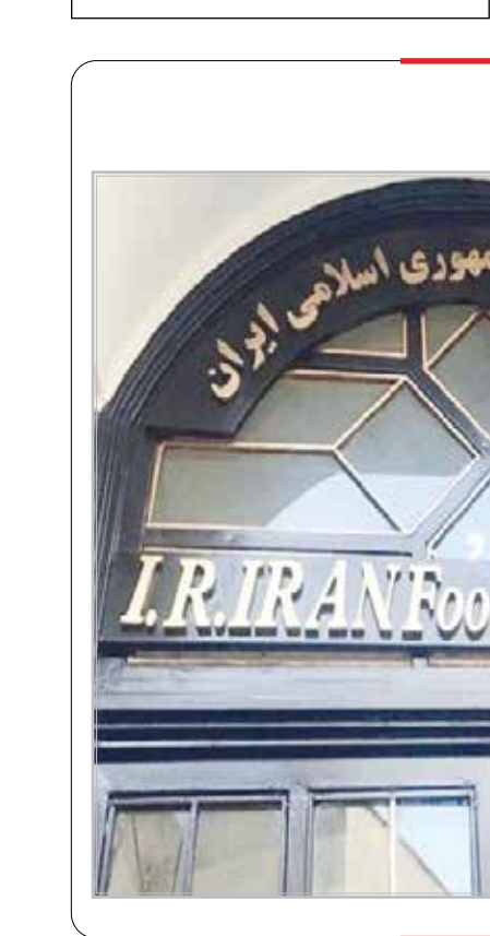
فدراسیون فوتبال جمهوری اسلامی ایران

دی لیبراتوروه شب گذشته در گفتگو با DAZN درباره این صحنه و جنجال به وجود آمده اظهار داشت: «دو اشتباه در این صحنه از سوی داور رخ داد. اول این بود که تماس بین این دو بازیکن خیلی آرام‌تر و سبک‌تر از چیزی بود که بخواد به عنوان خطا گرفته شود و دوم زمان‌بندی او برای این تصمیم بود. اگر داور در همان لحظه برای اعلام خطا سوت زده بود ممکن بود حتی ضربه آزاد گرفته شود و قضیه تمام می‌شد. اما او اجازه داد که بازی ادامه پیدا کند و سپس این کار را کرد و به همین دلیل چنین وضعیتی به وجود آمد. اشتباه اصلی در گرفتن خطا بود و بعد هم در زمان‌بندی داور برای سوت زدن که جنجال به همراه داشت.»