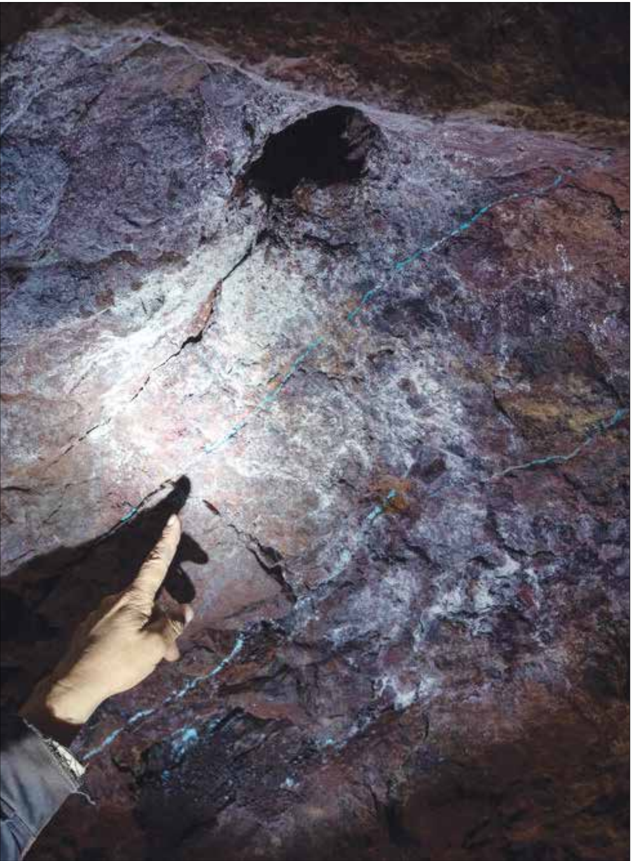
بزرگ‌ترین معدن فیروزه جهان