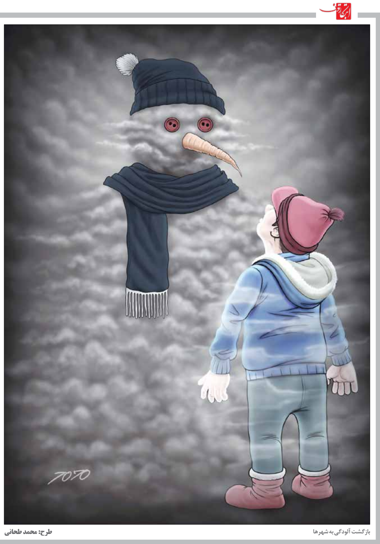
بازگشت آلودگی به شهرها