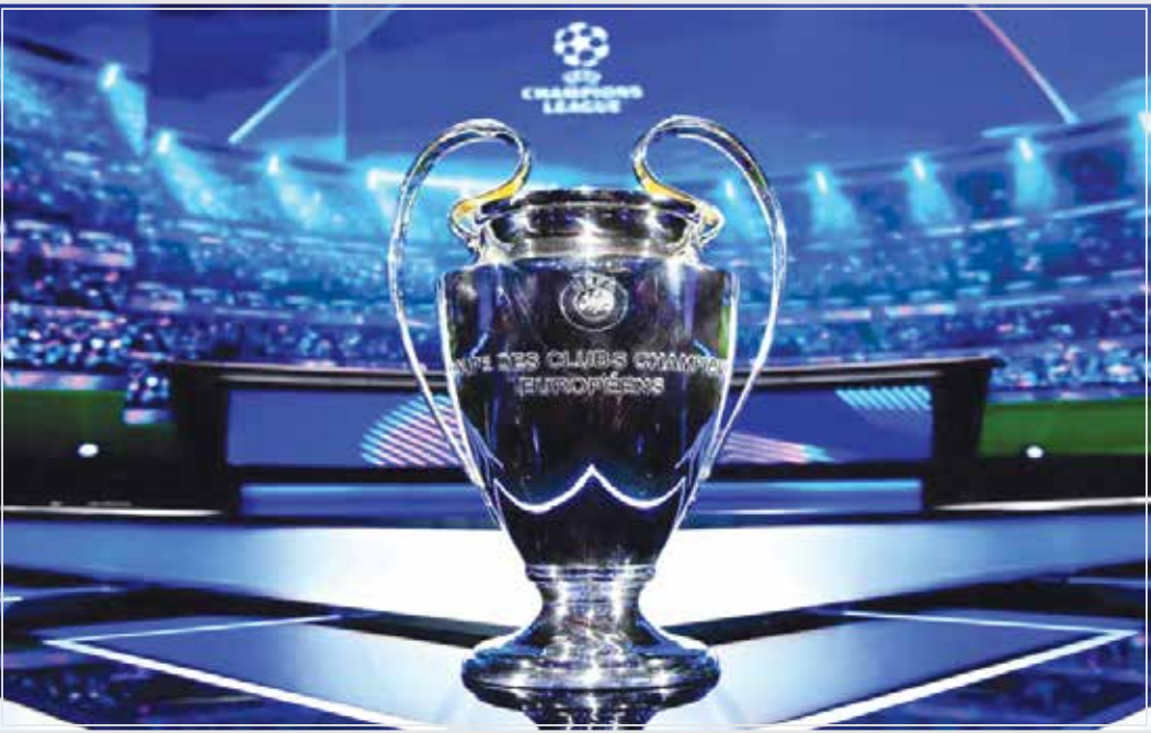
در این قرعه‌کشی، حریفان احتمالی در مرحله