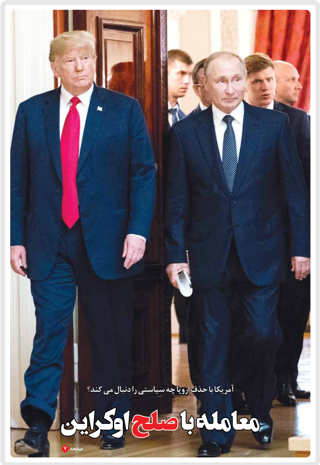
آمریکا با حذف اروپا چه سیاستی را دنبال می کند؟