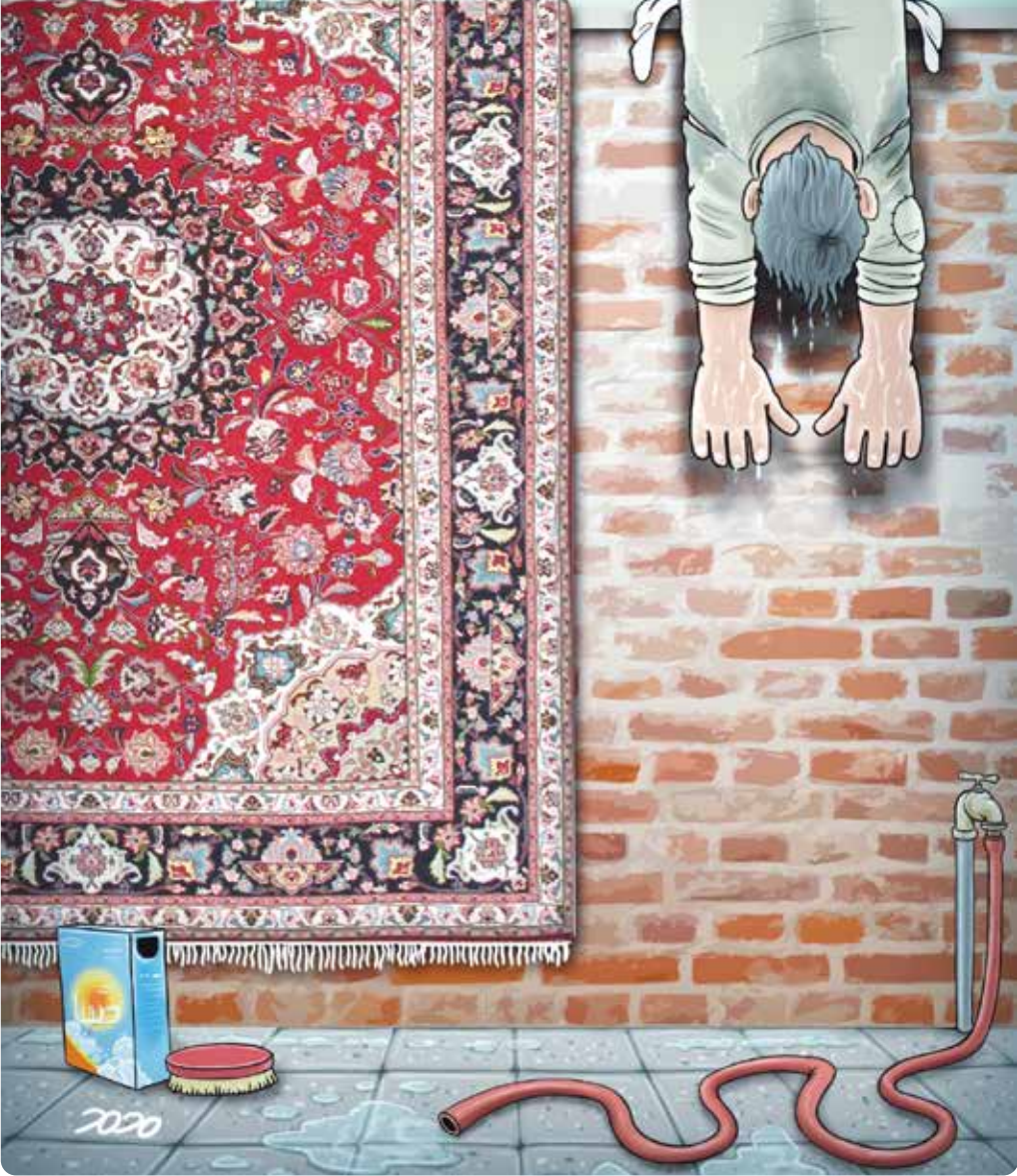
طرح: محمد طهمانی