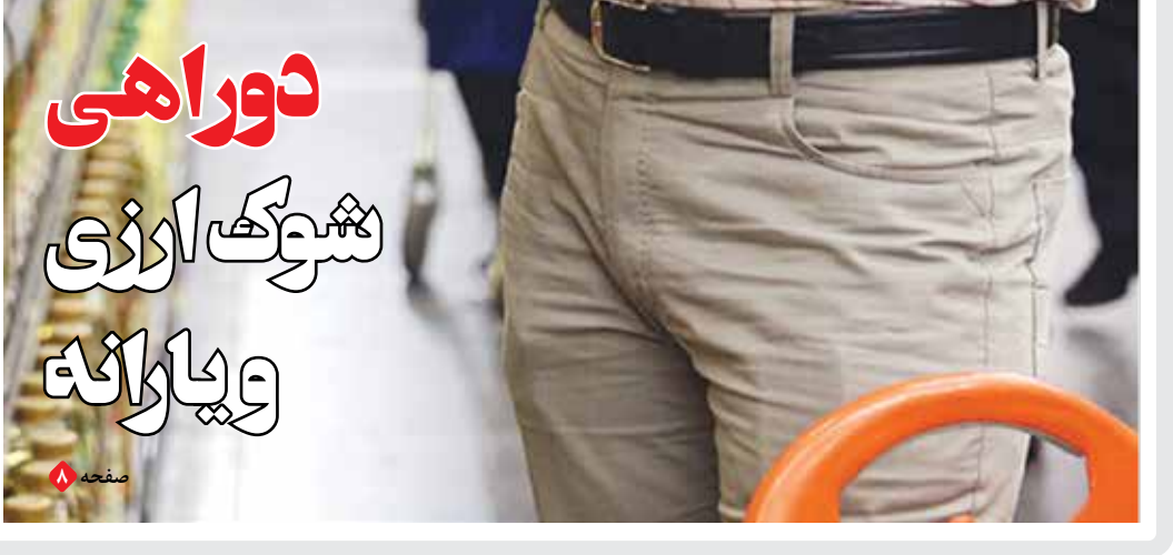
مشکلات معیشتی را حل می‌کند؟