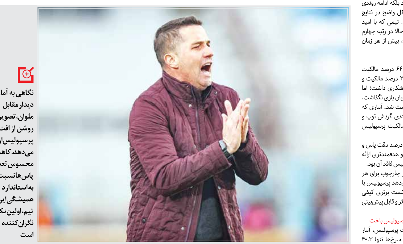
آمار علیه سرخپوشان مدعی

پرسپولیس یا شکست برابر ملوان چهارمین باخت فصل را تجربه کرد؛ تیمی که در یک ماه اخیر سه بار شکست خورده و با افت نگران‌کننده آماری، فرصت‌های قهرمانی را یکی‌یکی از دست می‌دهد.