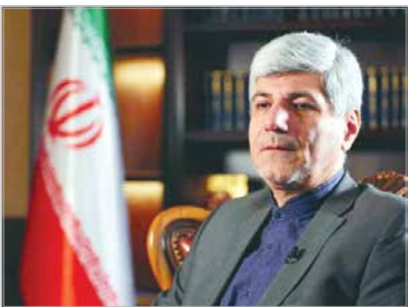
اکنون توپ در زمین آمریکایی‌هاست.

مهمان‌پرست با اشاره به تجربه‌ای که طرف آمریکایی از مذاکرات پیشین به دست آورده است، گفت: آنها به گفته خودشان برای حمله به ایران ۲۰ سال برنامه‌ریزی کرده بودند، افراد نفوذی خود را در نقاط مختلف مستقر کرده بودند و هم‌زمان با مذاکرات، برای سرنگونی ایران و نظام وارد جنگ شدند. تصورشان این بود که با هدف