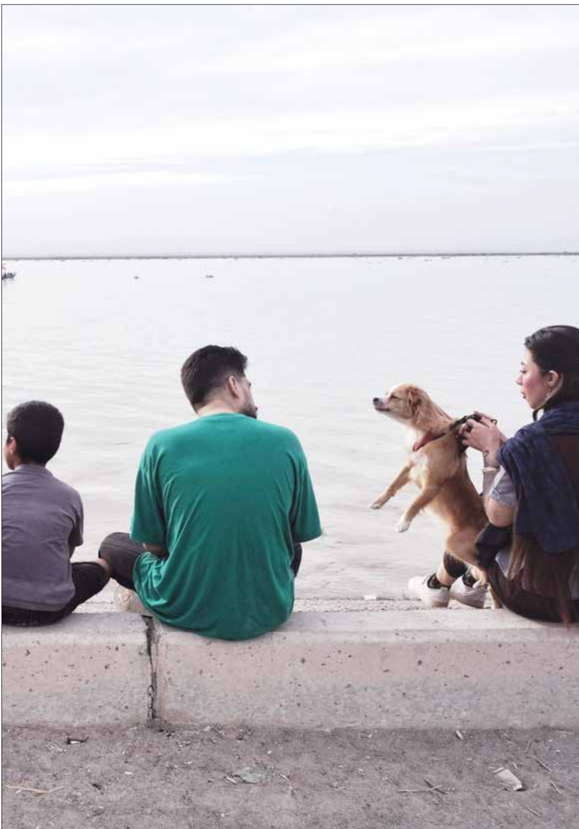
ورودی آب به سیستان پس از سال‌ها خشکسالی