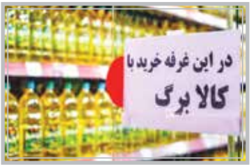
در این غره خرید با